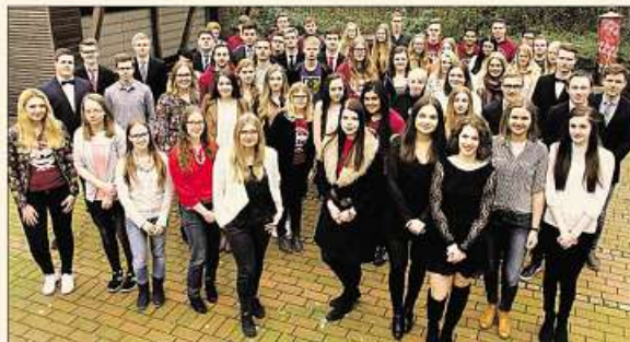
Stecken mitten im Abitur-Stress: die angehenden Abiturienten des Beruflichen Gymnasiums Wirtschaft der Berufsbildenden Schulen Friesoythe

FRIESOYTHE – Während draußen langsam der Frühling erwacht, heißt es für die angehenden Abiturienten in der Eisenstadt: lernen, lernen, lernen und viel Wissen abrufen. Denn jetzt wird es ernst. Der Startschuss zu den Abitur-Klausuren für die 128 angehenden Abiturienten am Albertus-Magnus-Gymnasium in Friesoythe fiel am Mittwoch, 22. März, im Fach Geschichte. Weiter geht es an diesem Donnerstag in Erdkunde, am Freitag greifen die Schülerinnen und Schüler